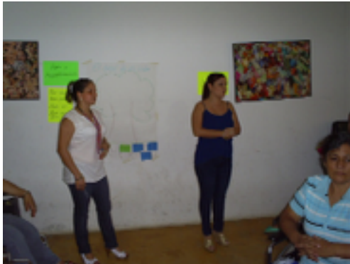
Actividad: “el árbol