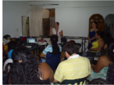
Auto reconocimiento y autoestima en mujeres.