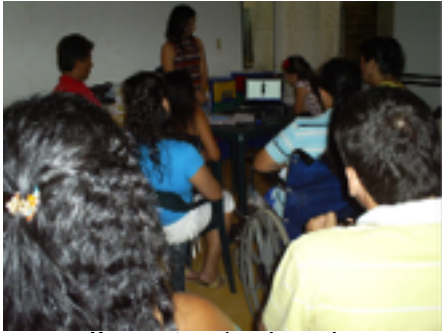
Presentación de video.